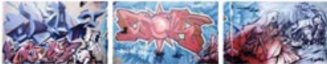
Fig. 101. Keith Haring.