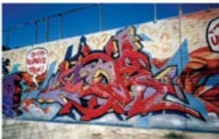
Fig. 102. Keith Haring.