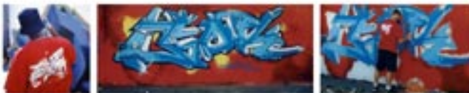
Fig. 100. Keith Haring.